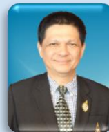
ศาสตราจารย์ นพ.ภิกเสก ลุมพิกานนท์