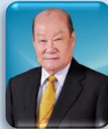
ศาสตราจารย์ ดร.วิจิตร ศรีอ้าน

ตามที่มหาวิทยาลัยเทคโนโลยีสุรนารี ได้ดำเนินการเพื่อทรงพระกรุณาโปรดเกล้าฯ แต่งตั้งนายกสภามหาวิทยาลัยและกรรมการสภามหาวิทยาลัยผู้ทรงคุณวุฒิของมหาวิทยาลัยเทคโนโลยีสุรนารีนั้น บัดนี้ ได้มีพระบรมราชโองการโปรดเกล้าฯ แต่งตั้งนายกสภามหาวิทยาลัยและกรรมการสภามหาวิทยาลัยผู้ทรงคุณวุฒิของมหาวิทยาลัยเทคโนโลยีสุรนารีชุดใหม่ รวม 13 ท่าน (ราชกิจจานุเบกษา เล่ม 134 ตอนพิเศษ 99 ง 7 เมษายน 2560) ประกอบด้วย